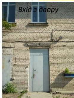
Вхід з двору