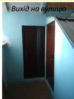
Вихід на вулицю