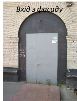
Вхід з фасаду