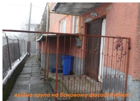
вхідна група на боковому фасаді будівлі